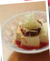
高とろがらしの 自家製ラー油の冷奴