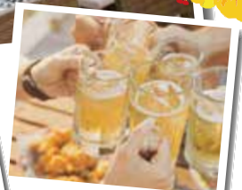
ガーデンテラスで焼酎