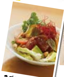
ワゴロとポカドの ホキ貝マリキ