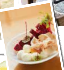
生ハムとドラゴンフルーツの カブレーゼ