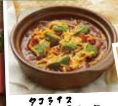
タコライス トルティーヤ