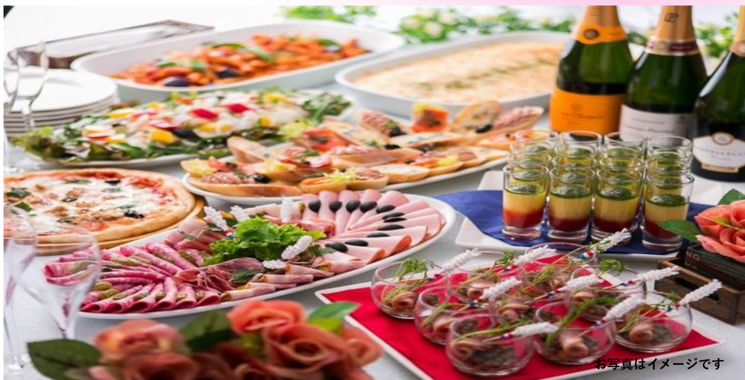
お写真はイメージです

ホテルローズガーデン新宿がお届けする春のパーティープラン。大人数でも安心な、完全プライベートルームはコンセプトの違うオークルーム、ローズルームの2施設でバリエーション豊かなブッフェ料理とドリンク飲み放題プランをご用意しております。親しい方々との集いや歓送迎会など、ご利用に応じてコースをお選びいただき、思い出に残る楽しいひとときをお過ごしください。お料理スタイルは大皿スタイルでのアレンジや本格的なフレンチイタリアンのフルコースもご用意しております。