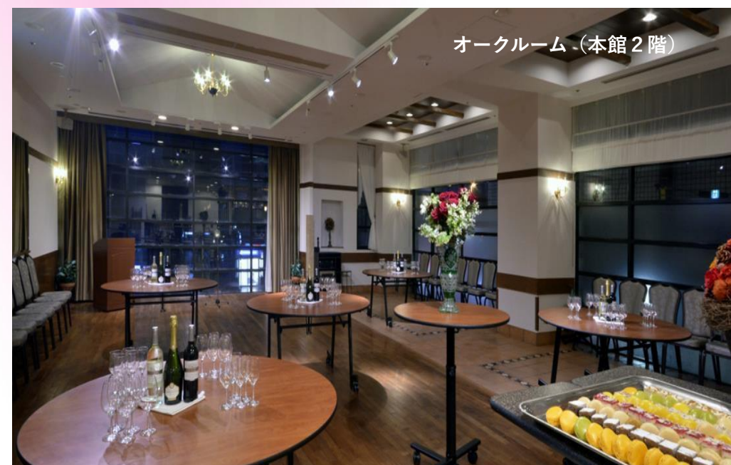
オークルーム (本館2階)

¥8,800プラン 料理12品 特選生ハムの盛り合わせ トラウトサーモンスモークの香り タコのカルパッチョセルパチコ添え アソーテッドカナッペ 本日のサンドウィッチ 干しエビと彩り野菜サラダマルシェ モチモチリングイネ生パスタ パーティーピッツァ バジルソーセージとジャガイモソテー本 日の鮮魚のパワレアンチョコクリーム ニュージーランド産牛サーロインジャリアピンソース プチガトー盛り合せ三種