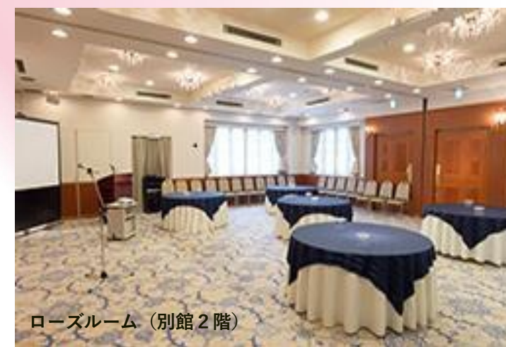
ローズルーム (別館2階)

¥6,600プラン 料理9品 コールドミート三種盛り合わせ (鴨の味噌漬け・鶏肉のテリーヌ・パストラミハム) トラウトサーモンスモークの香り マーブルチーズとスモークチーズのカナッペ 本日のサンドウィッチ 筍とバジルチーズのペネサラダ モチモチリングイネ生パスタ パーティーピッツァ フリットミスト盛り合せ つくば鶏ムネ肉のロースト和風おろしソース