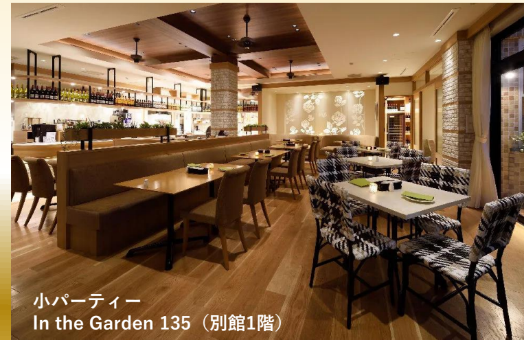
小パーティー In the Garden 135 (別館1階)

ホテルローズガーデン新宿がお届けするこの冬のプラン。皆様に一時のオアシスとしてお気軽にご利用頂ける様 オークルーム、ローズルームの2施設でバラエティー豊かな料理とドリンク飲み放題プランをご用意しております。 親しい方々との集いや、歓送迎会など、ご利用に応じてコースをお選びいただき、楽しい冬のひとときをお過ごしください。