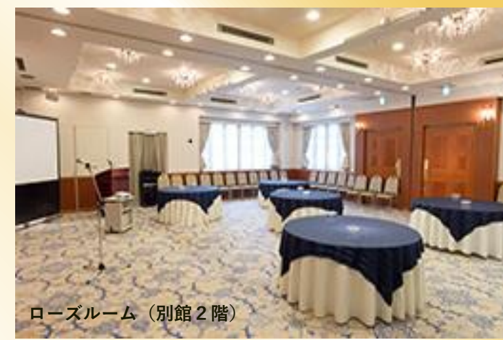
ローズルーム (別館2階)