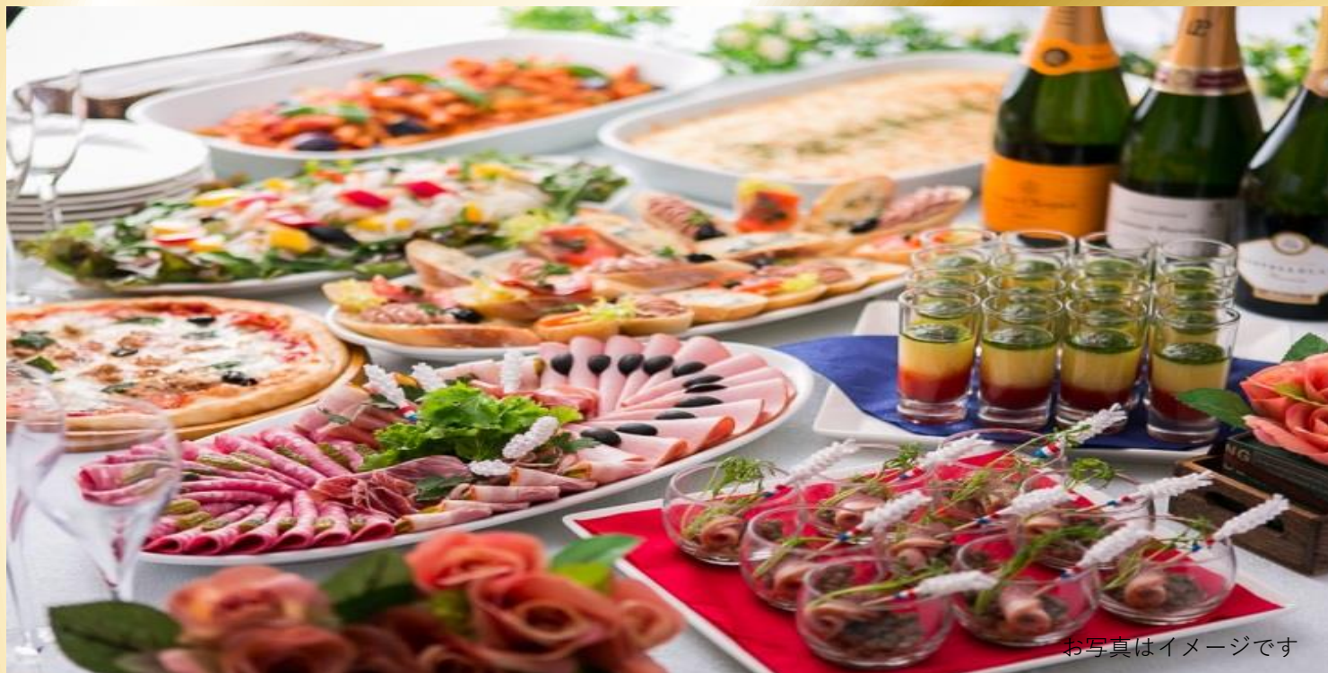
お写真はイメージです