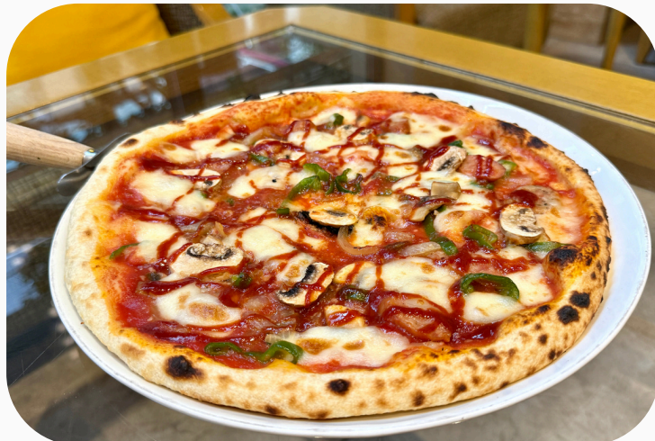
ナポリタンピッツァ ¥1,485