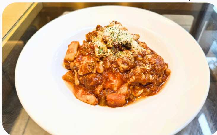
豚バラ肉と白いんげん豆の トマト煮ソースのオムライス ¥1,650