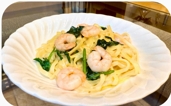
エビとホウレン草のクリームパスタ ¥1,320