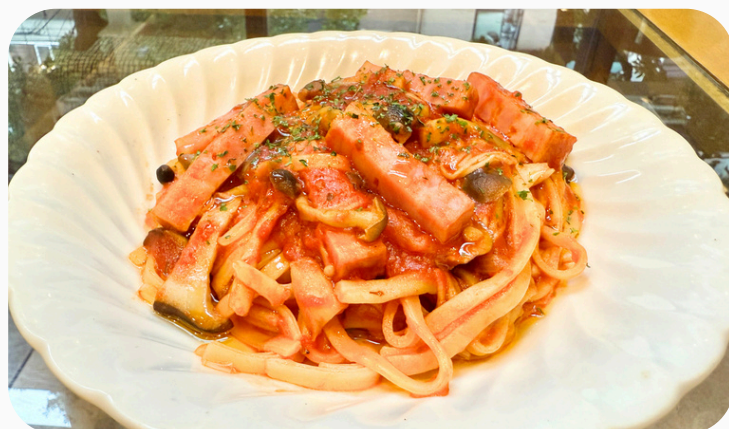
ベーコンとキノコのトマトパスタ ¥1,320