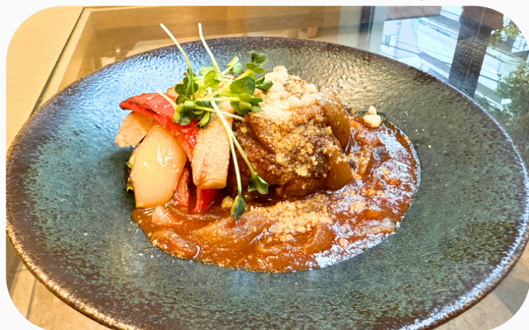
カレー煮込みハンバーグ (ライス付) ¥1,760