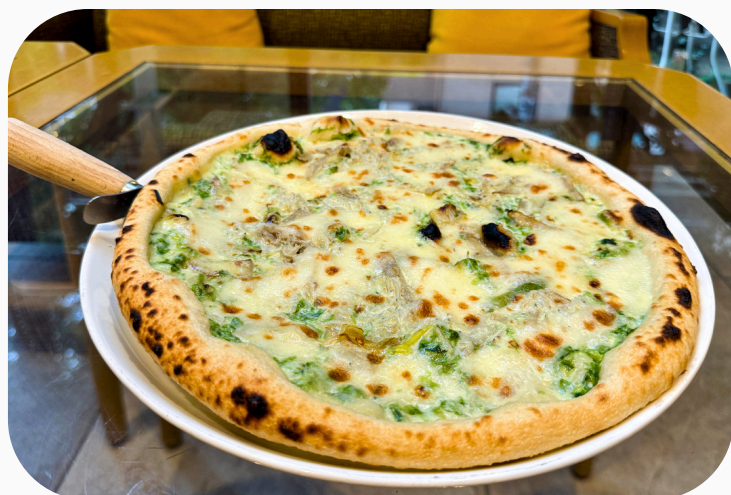
シラス、青のり、ゴボウ、長ネギの クリームピッツァ ¥1,595