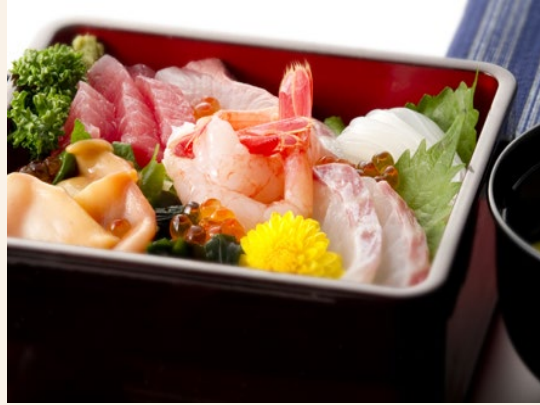
GW特別福井産直海鮮重御膳 福井県産地直送海鮮重小鉢 味噌汁 香の物 一八〇〇(税込)