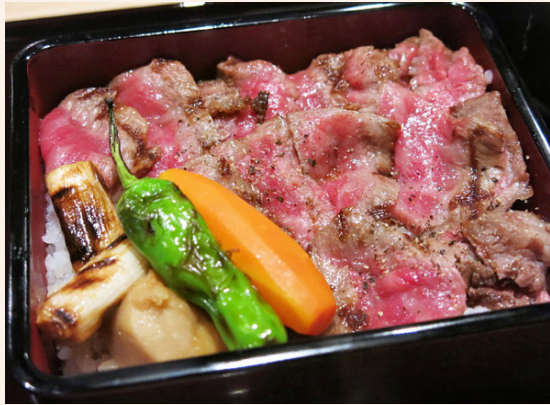
GW特別仙台牛赤身肉炙り重御膳 仙台牛赤身肉炙り重小鉢 味噌汁 香の物 一八〇〇(税込)