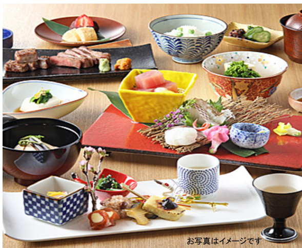
お写真はイメージです

特別会席 前菜 下仁葱和風ぶりんとんぶりべつ甲銘掛 生姜 吸物 蛤真丈 独活 木の芽 若布 こごみ 造り さしみ蒟蒻薄造り 辛子味噌 旬の鮮魚盛合せ 芽物色々 焼八寸 群馬牛炙り 鯖棒寿司 海老パン 挟み揚げ 鰯香梅煮 焚合せ 海老芋 京人参 堀川牛蒡 青菜巻湯葉 鱈子旨煮 食事 群馬県名産 ひもかわうどん 小柱かき揚げ 甘味 上州名物 焼饅頭 味噌だれ 時果 季節の果物