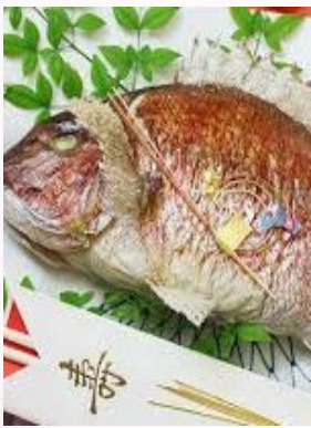
オフシヨン ホールケーキ四号 鯛姿焼 一台 食事を土鍋の鯛御飯に変更 致します。 一〇〇〇〇円