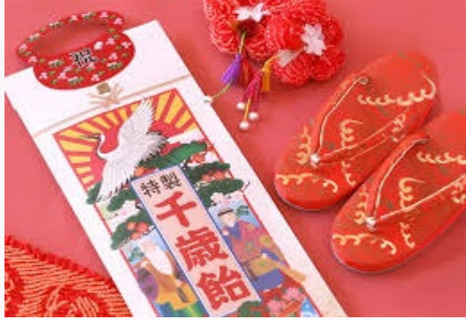
親族中心の会食 4名~20名で 日本料理レストランを貸切出来ます

西新宿は徒歩1分のホテルローズガーデン新宿 新館1階に こじんまりと佇む『日本料理 栗吉』自邸にお客様を招いて.. ローズガーデンのコンセプト。そんな少人数での貸切会場です。