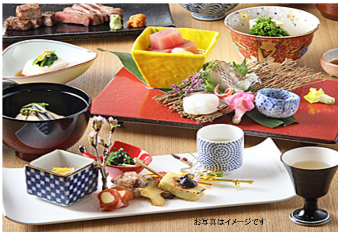
お写真はイメージです

特別会席 先付 酒粕白和え 造り 旬の造り盛り合せ 煮物 丸茄子海老炊き合わせ 焼物 福島産根田の味噌を 使った鱸の田楽焼 雲丹焼き 揚物 馬肉唐揚げ 食事 福島県産 そば粉の練蕎麦 甘味 若桃ゼリー