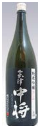
会津中將 純米吟醸 夢の香火入れ