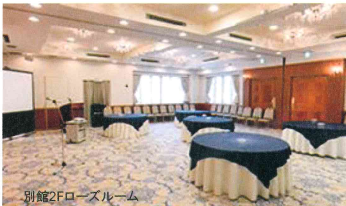
別館2Fローズルーム