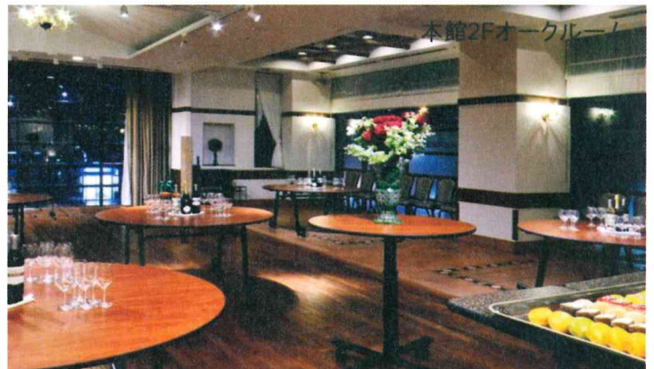
本館2Fオークルーム

冷製ハム盛り合せ 四種 ローストチキンと牛蒡のシザーサラダ 小海老のアヒージョ スモークチーズトースト 本日のパスタ2種 本日のお勧めピザ チョリソーと春巻き スティック 豚バラと大山鶏、冬野菜の豆乳ポトフ 牛カルビ ステーキ