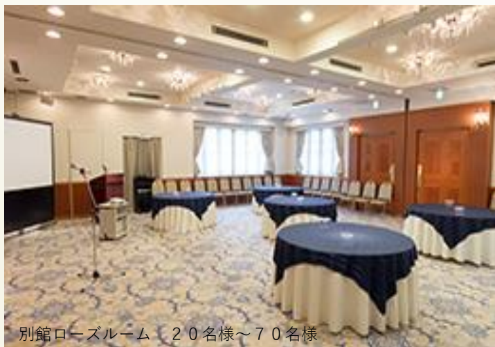
別館ローズルーム 20名様～70名様