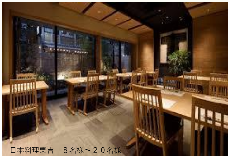
日本料理栗吉 8名様～20名様